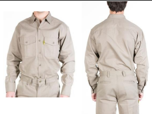
Tabla de talles según IRAM 75300