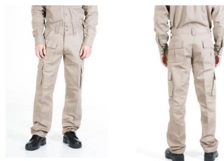
Tabla de talles según IRAM 75300